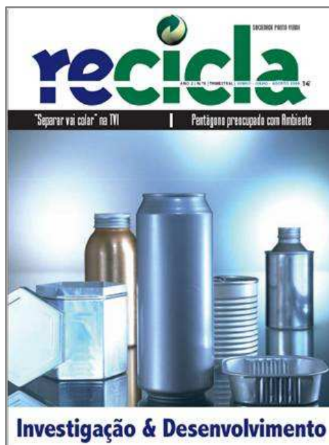
FIGURA 1 - RECICLA