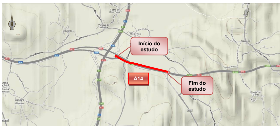
Figura 1 – Enquadramento geográfico do sublanço em análise

Na Figura 1 apresenta-se um enquadramento geográfico do sublanço em estudo.