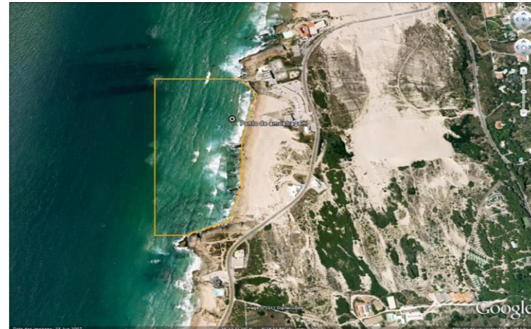
Figura 1 - Água balnear e ponto de amostragem (LAT 38.726295º, LONG-9.476987º, ETRS89) Figure 1 - Bathing water and sampling point (LAT 38.726295º, LONG-9.476987º, ETRS89)