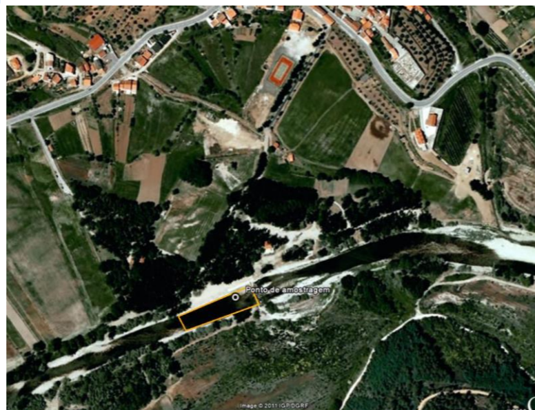
Figura 1 - Água balnear e ponto de amostragem (LAT 40.402705º, LONG -7.402978º, ETRS89) Figure 1 - Bathing water and sampling point (LAT 40.402705º, LONG -7.402978º, ETRS89)

Concelho: Guarda Código Água Balnear: PTCT9E Bacia Hidrográfica: Bacia Hidrográfica do Rio Tejo Massa de água: Rio Zêzere ÉPOCA BALNEAR 2021: 1 Julho a 31 Agosto Frequência de amostragem: Quinzenal