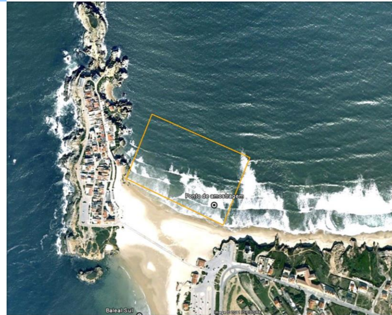
Figura 1 - Água balnear e ponto de amostragem (LAT 39.3738º, LON -9.337133º, ETRS89) Figure 1 - Bathing water and sampling point (LAT 39.3738º, LONG -9.337133º, ETRS89)

Concelho: Peniche Código Água Balnear: PTCW2T Bacia Hidrográfica: Ribeiras do Oeste Massa de água: CWB-II-3 ÉPOCA BALNEAR 2021: 12 Junho a 12 Setembro Frequência de amostragem: Cada 3 semanas