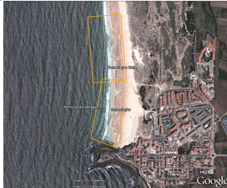
Figura 1 - Água balnear e ponto de amostragem (LAT 39.326958º, LON -9.35977º, ETRS89) Figure 1 - Bathing water and sampling point (LAT 39.326958º, LONG -9.35977º, ETRS89)

De acordo com o nº6 do Artº7º do D.L. 135/2009, republicado pelo D.L.113/2012, as águas balneares de Consolação e Consolação Norte foram agrupadas, (PTCW7VG) sendo Consolação o ponto de amostragem representativo do agrupamento.