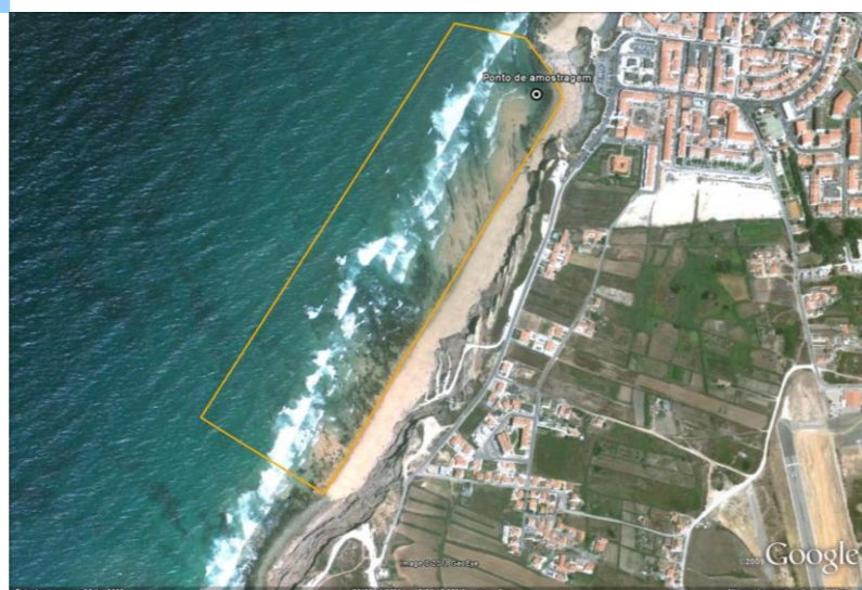
Figura 1 - Água balnear e ponto de amostragem (LAT 39.131775º, LONG - 9.385694º, ETRS89)

Frequência de amostragem: Cada 3 semanas