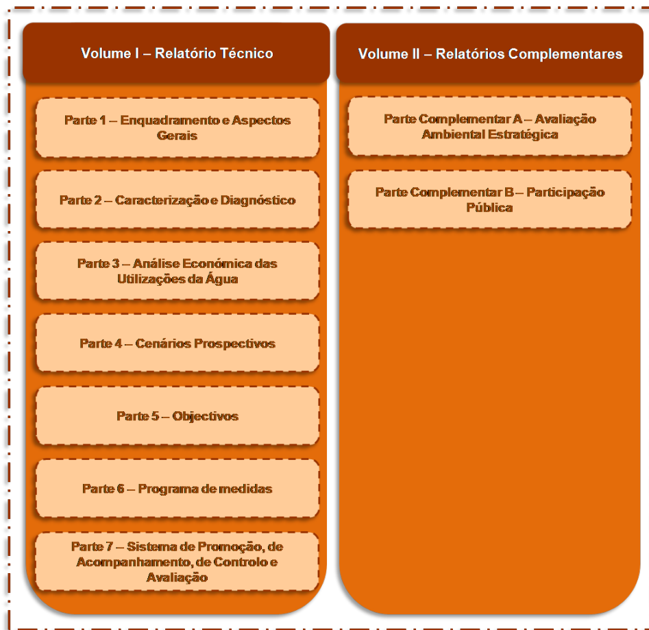
Figura 1.3 – Estrutura dos conteúdos do PBH Ribeiras do Oeste.

O presente relatório constitui-se como a versão extensa Relatório Técnico final do PBH Ribeiras do Oeste. Os conteúdos aqui apresentados são ainda complementados com informação adicional. Deste modo, no presente relatório os seguintes símbolos remetem: